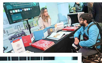
Las diversas fundaciones que participaron del encuentro explicaron los proyectos que están impulsando para la revitalización de los espacios públicos.