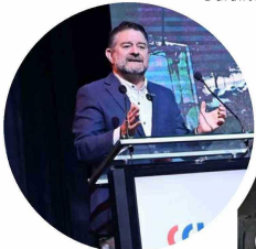
Claudio Orrego, gobernador de la Región Metropolitana, presentó el proyecto Nueva Alameda.