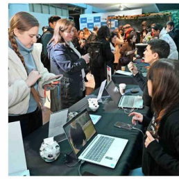
Los asistentes recorrieron los diferentes stands de las fundaciones y universidades que colaboraron en esta 13ª versión de la conferencia organizada por la CChC.