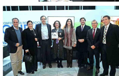
Autoridades de la CChC visitaron el stand de la Corporación Ciudad Accesible.