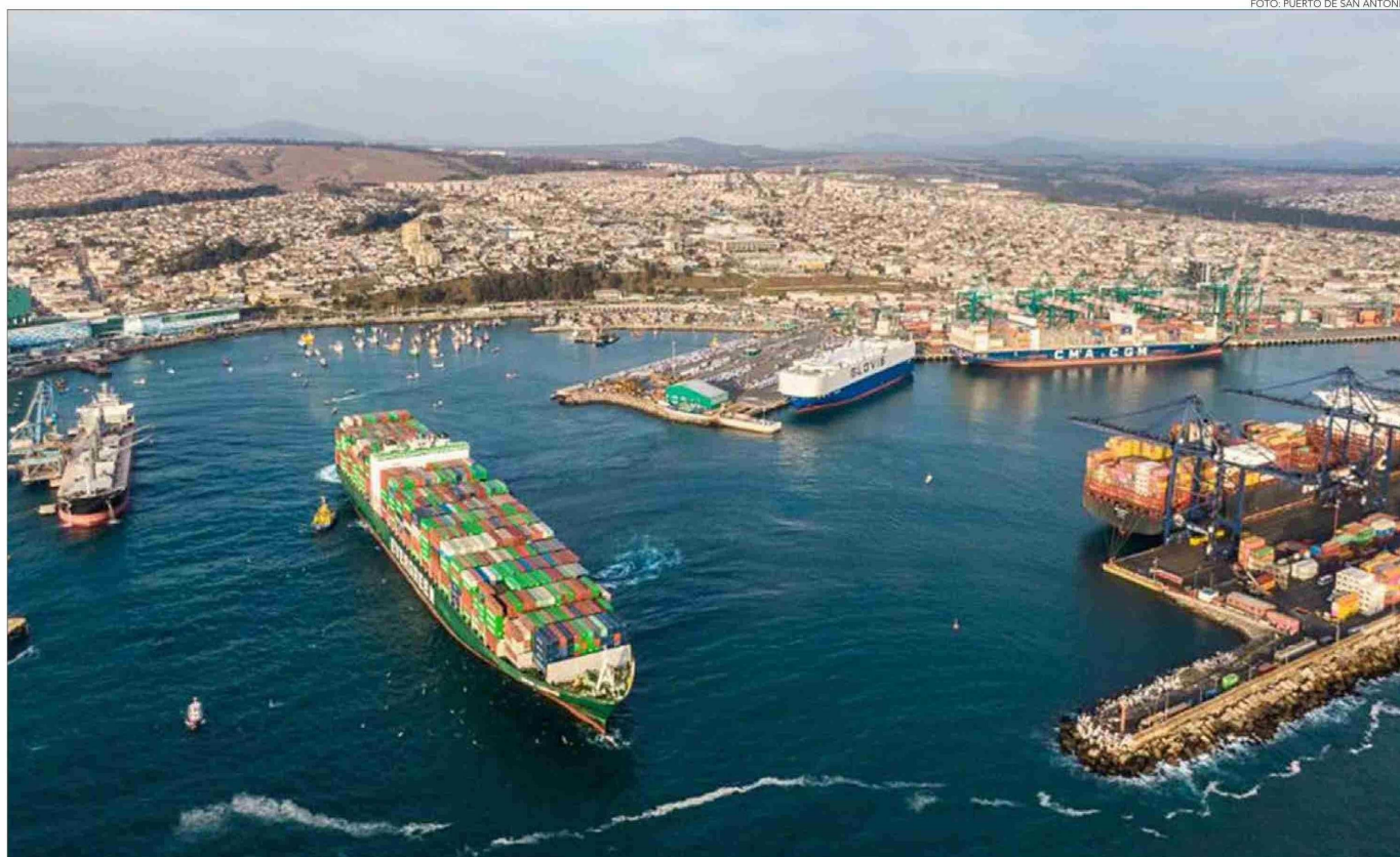
FOTO: PUERTO DE SAN ANTONIO