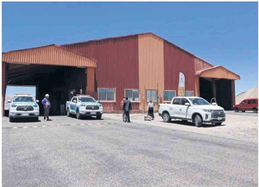
EL PASO SAN FRANCISCO ES LA GRAN ENTRADA POR TIERRA DESDE ARGENTINA A LA REGIÓN DE ATACAMA Y AHORA FUNCIONA TODOS LOS DÍAS.