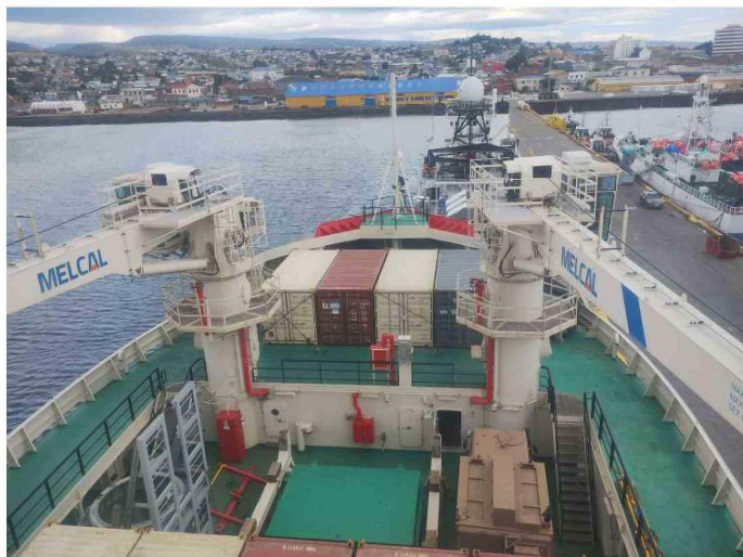
El buque está preparado para atender cualquier tipo de urgencias médicas, con catres clínicos y atención personalizada.