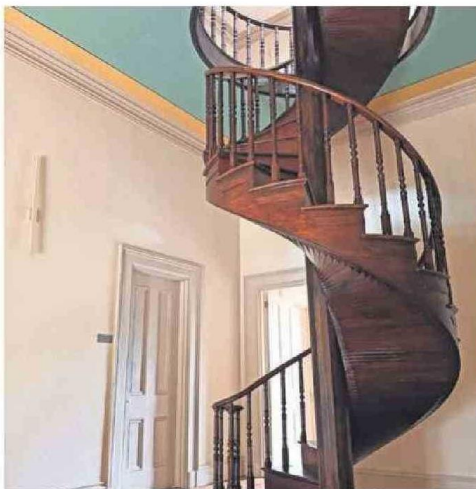
AUTORIDADES, ACADÉMICOS Y EXINTEGRANTES DE LA ESCUELA NORMAL DE COPIAPÓ ASISTIERON A LA ENTREGA EL AÑO PASADO.

“Uno no es solamente la maestra que enseña. Nunca