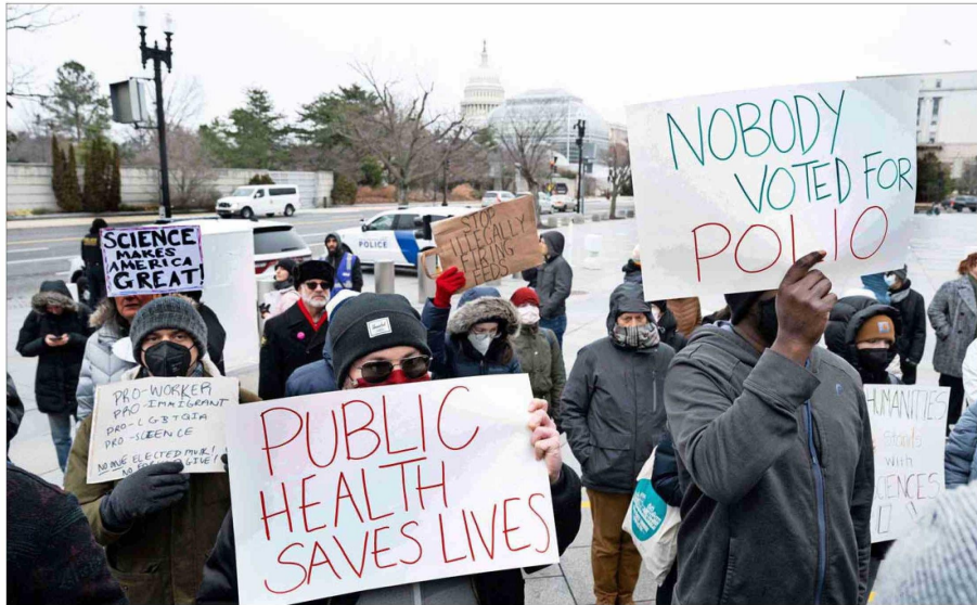
Investigadores y sociedad civil protestaron fuera de las oficinas del Departamento de Salud y Servicios Humanos hace un par de semanas para rechazar los recortes a la ciencia que impulsó el gobierno de EE.UU.