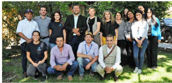
Vecinos de Codegua, beneficiados de "Impulsa Agua", junto al equipo de Agrosuper y Fundación Amulén.