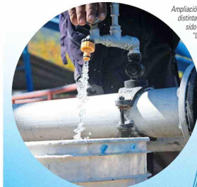
Ampliación de matrices en distintas localidades han sido posible gracias a "Impulsa Agua".