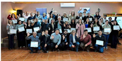
El programa "Impulsa Agua" ha desarrollado una serie de capacitaciones con el fin de mejorar la administración de los SSR.