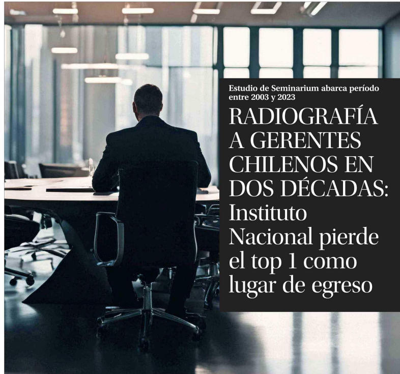
Estudio de Seminarium abarca período entre 2003 y 2023

En educación superior, la casa de estudios prioritaria de altos ejecutivos se mantiene en el tiempo, aunque con variaciones. Las universidades de egreso siguen encabe-