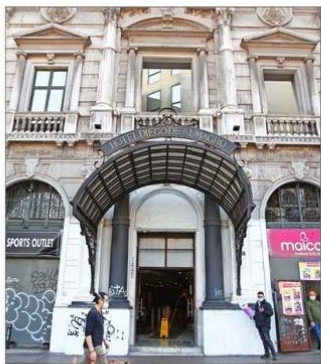
En la Región Metropolitana hay 57 hoteles que pueden hospedar personas que lleguen desde el extranjero

Junto con el precio, los viajeros también critica-