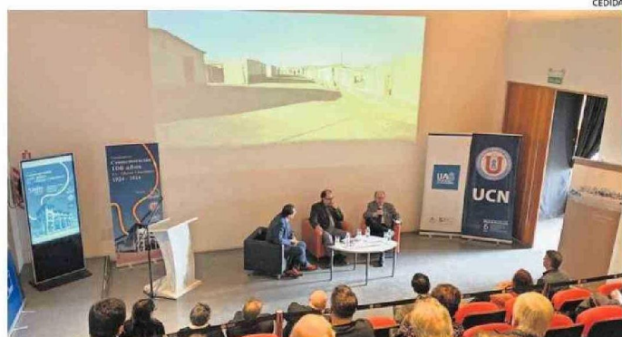
POR LA IMPORTANCIA QUE TIENE PARA LA REGIÓN Y EL PAÍS MANTENER EL LEGADO DE CHACABUCO.

En conversatorio organizado por la Corporación Museo del Salitre Chacabuco, la UCN y la UA, especialistas abordaron estado actual y proyección del monumento nacional.