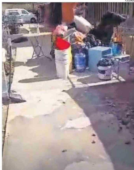
SE DAÑARON LOS ENSERES DE LOS VECINOS.

Luego del aluvión de 2015, según vecinos, la planta dejó su funcionamiento, lo que ha causado problemas porque a pesar del paso de los años no han visto una respuesta de las autoridades. "Hay malos olores, debiera hacerse una limpieza y la mantención de los