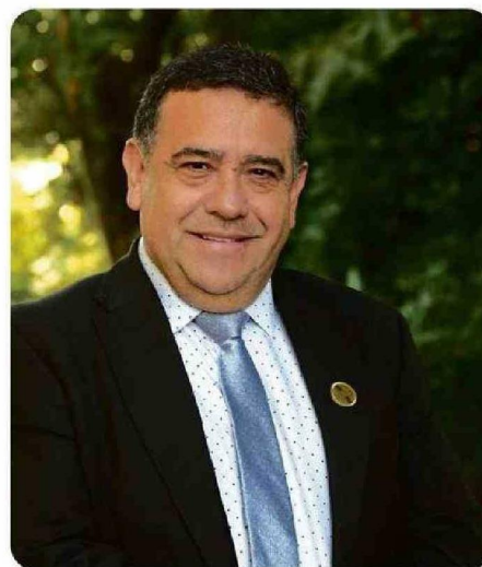
Patricio Fuentes, consejero regional y vicepresidente de la Comisión Social del organismo

El programa FNDR Mujeres Emprendedoras no solo mejoró la independencia económica de las mujeres usuarias del programa, sino también impactó positivamente en la economía regional al fomentar un ambiente de crecimiento sostenible y autónomo para los nuevos emprendimientos.