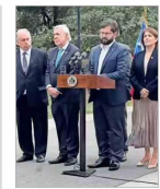
El jefe de Estado, al hablar con la prensa en su último día en EE.UU.