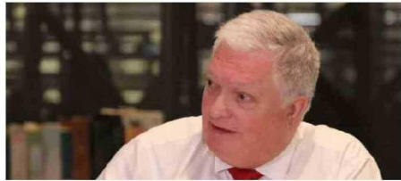
El senador Kusanovic destacó la necesidad de promover el Territorio Chileno Antártico.

Finalmente, el senador recordó que el mapa oficial de Argentina incluye también en la misma escala el territorio continental y sus reclamaciones antárticas.