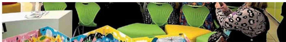
EN CALAMA, EL TALLER DE MEDIACIÓN LECTORA FUE REALIZADO EN EL COLEGIO GUADALUPE DE AYQUINA.

En las instancias se entregaron herramientas de mediación lectora a quienes están a cargo de los espacios dedicados a fomentar la lectura en las unidades educativas, "además de abordar temas primordiales como el Plan de Reactivación Educativa, la Política Nacional del Libro