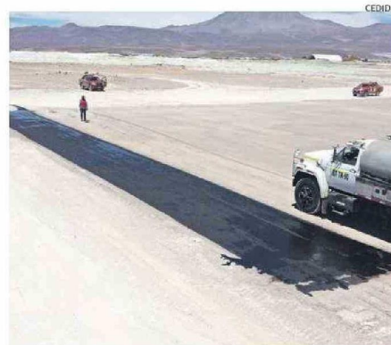
TRABAJOS PARA HABILITAR LA POSADA DE HELICÓPTERO EN OLLAGÜE.