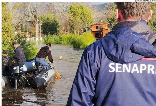
DESDE SENAPRED INFORMARON QUE EN LOS PRÓXIMOS DÍAS LAS PRECIPITACIONES DECAERÁN EN LA REGIÓN.

Siempre en esta comuna, equipos de Senapred evacuaron a medio de centenar de personas en el sector de Imulfudi a causa del desborde del río Cruces. Misma situación ocurrió en el sector La Isla por la subida de nivel del río Leufucade, donde fueron evacuadas