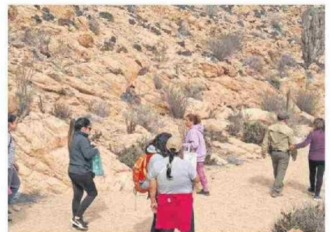
ES UN SERVICIO COMPLEMENTARIO A LA SALUD TRADICIONAL.