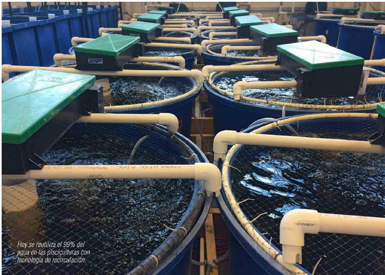
Hoy se reutiliza el 99% del agua en las pisciculturas con tecnología de recirculación.