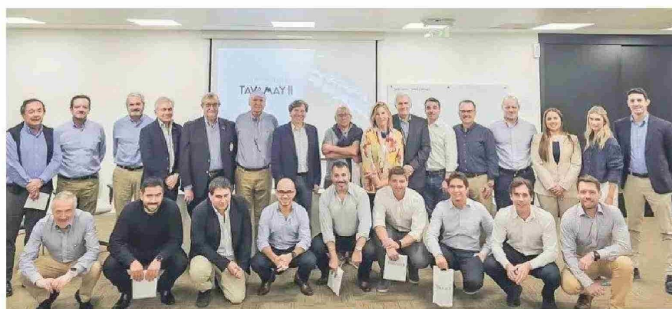
Arriba, el grupo de inversionistas, y al lado, el Presidente de Paraguay, Santiago Peña, junto a Laurence Golborne.

En particular, el actual presidente de Paraguay, Santiago Peña -un economista graduado en Columbia y ex ministro de Hacienda- ha sido un activo promotor del crecimiento. "Él