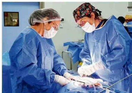
DE CUATRO A SEIS AUMENTARON LOS PABELLONES.

mos a ampliar nuestra cantidad de pabellones y llegar a más gente para resolver sus listas de espera, entregando la mejor tecnología y seguridad. Así que estamos muy felices, y continuaremos haciendo todo lo posible para que la salud de la provincia esté