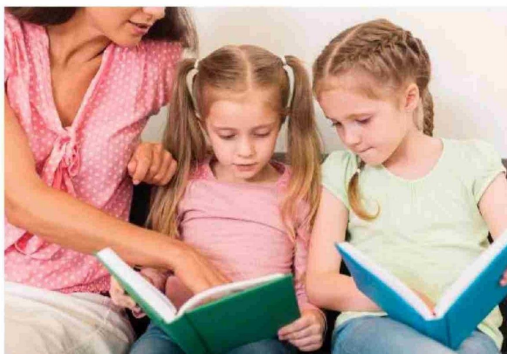
MADRE DANDO INDICACIONES de lectura a sus hijas pequeñas.

“Para aprender a leer hay que leer y fomentar la lectura más allá de las tareas escolares. Un niño que no lee en casa durante su tiempo de ocio jamás se convertirá en un verdadero lector. Acabará dominando la descodificación y la comprensión de los textos más comunes, pero será incapaz de penetrar en la inmensa riqueza de los contenidos complejos”, adelanta.