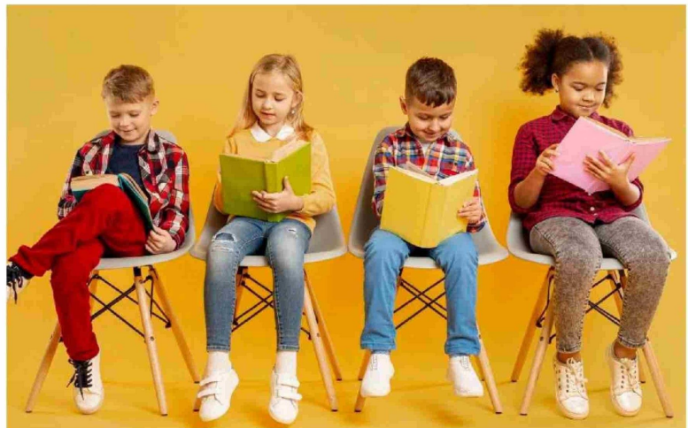
GRUPO DE NIÑOS leyendo en sus asientos, con fondo amarillo.

“Es fundamental que los menores lean desde su más tier-