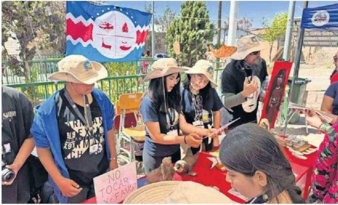
LOS CHICOS DE LA E-10 PRESENTARON LA CULTURA DEL PUEBLO CHANGO.