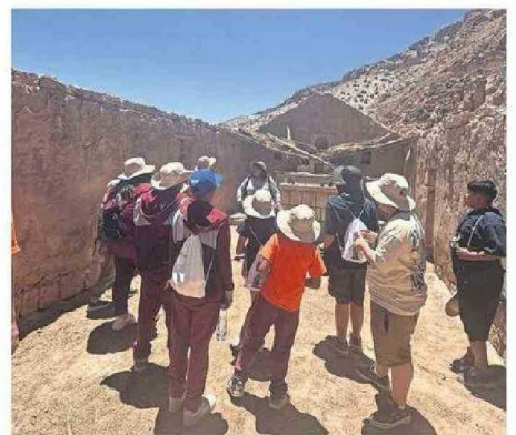
RECORRIERON LUGARES ICÓNICOS DE LOS LICKANANTAY.