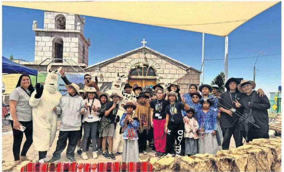
LOS ESTUDIANTES TOCOPILLANOS VIVIERON UNA GRATA EXPERIENCIA EDUCATIVA AL INTERIOR DE LA REGIÓN DE ANTOFAGASTA.

Es preciso destacar que este proceso educativo inició en agosto cuando los estudiantes de la Escuela G-22 del poblado de Camar arribaron a Tocopilla para recorrer el borde costero y así descubrir la geografía, flora, fauna y el patrimonio cultural del pueblo Chango.