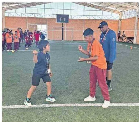
JUGARON Y CONOCIERON A NIÑOS DE LOS PUEBLOS DEL INTERIOR.