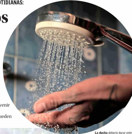
La ducha debería durar entre 10 y 15 minutos, mientras que la temperatura del agua debe estar en torno a 38 grados. Se recomienda también la instalación de barras de agarre.

Un área sin riesgos es crucial para las personas mayores porque ayuda a prevenir lesiones, que son comunes en superficies mojadas. Evitar estos accidentes es fundamental para mantener la salud y la movilidad de los seniors, quienes pueden realizar ciertas adaptaciones físicas en este entorno.