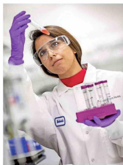
Descubrir, desarrollar y ofrecer medicamentos innovadores que ayuden a los pacientes a superar enfermedades graves son los objetivos de Bristol Myers Squibb.

hematología, inmunología, entre otras. Además, marca un trabajo continuo con la investigación y desarrollo (I+D) de medicamentos innovadores, donde la expansión de ensayos clínicos permitirá acelerar la llegada de tratamientos pioneros al país.