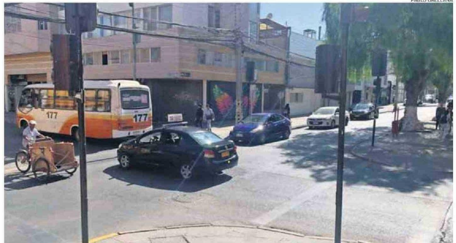
ALGUNOS SEMÁFOROS SE MANTUVIERON INHABILITADOS TRAS LA REPOSICIÓN DEL SUMINISTRO ELÉCTRICO EN CALAMA.

“El hospital tenía autonomía suficiente para operar durante más de 48 horas sin electricidad externa, lo que garan-