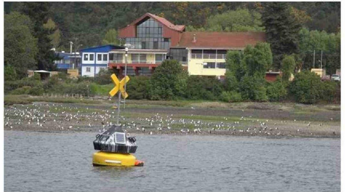
EN 2017 FUE INSTALADA LA PRIMERA BOYA EN EL SENO DEL RELONCAVÍ; Y EN 2021 LA DEL CANAL DE TENGLÓ.

"La toma de decisiones y creación de políticas públicas en esta materia, debe respaldarse en evidencia científica confiable", enfatiza la también miembro activo de la Red Glo-