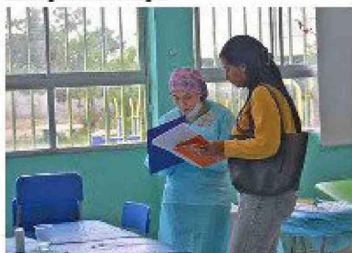
Más de 280 personas recibieron atención de salud en una jornada con especialistas y terapias complementarias.

E l pasado sábado, el Rotary Club Cachapoal, junto a otros clubes rotarios de la región y Santiago, llevó a cabo un exitoso Operativo Médico Interclubes en el Colegio Jean Piaget, ubicado en el sector poniente de la ciudad. La actividad, desarrollada entre las 10:00 y las 16:30 horas, ofreció atenciones gratuitas en diversas áreas de la salud a más de 280 personas.