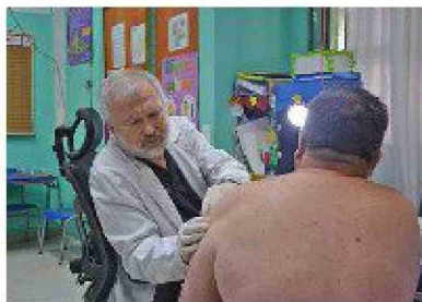
Rotarios realizan exitoso operativo médico gratuito en Rancagua.