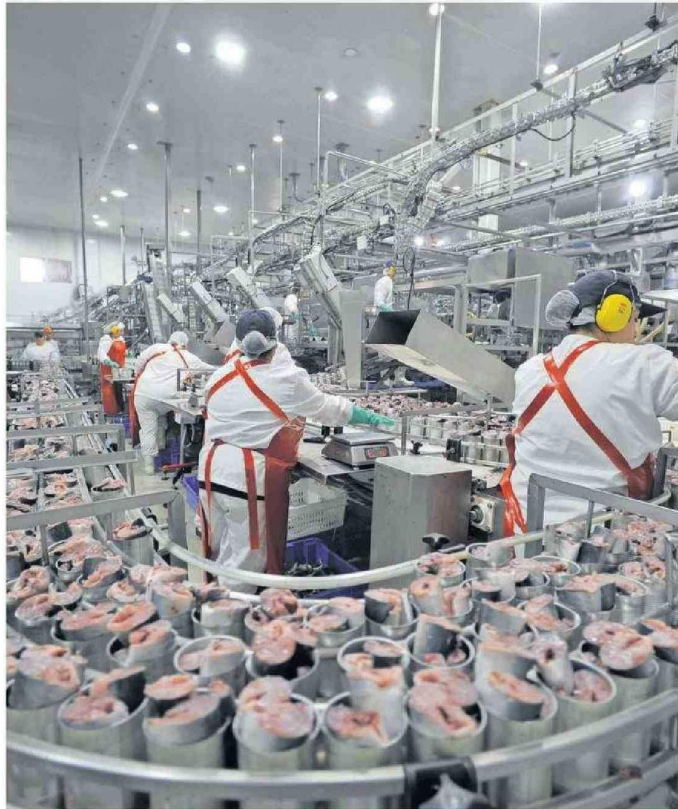
Desde el gremio de la pesca aseguran que el proyecto de ley de fraccionamiento afectará el empleo.