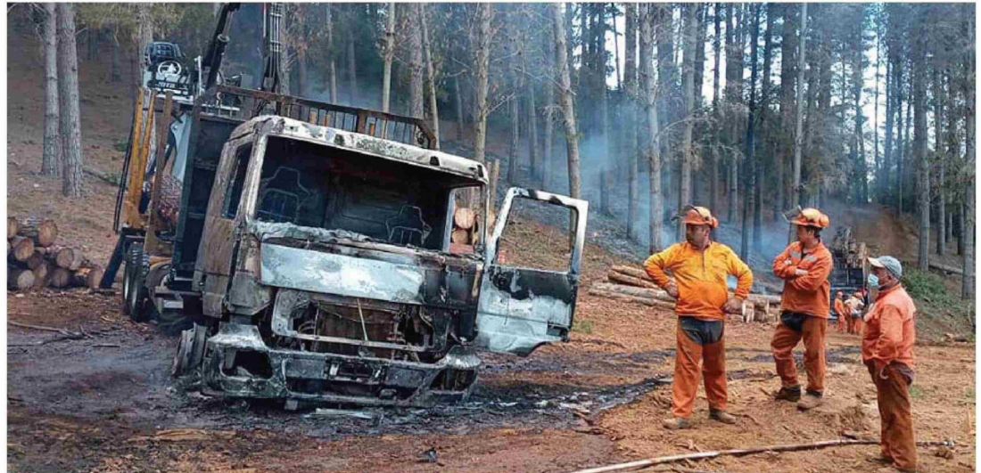
EN UN 35% HAN BAJADO los atentados en 2024 en comparación con 2023.

La Asociación de Contratistas Forestales (ACOFORAG) informó que los atentados registrados en la Macrozona Sur disminuyeron un 35% en 2024, pasando de 40 incidentes en 2023 a 26 el año pasado.