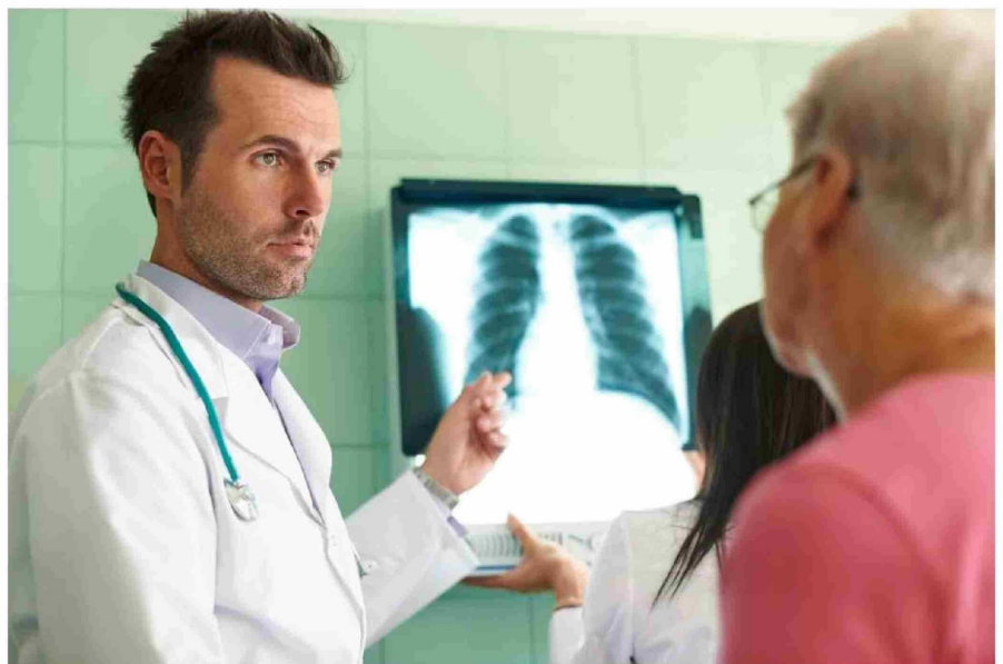
DETECTAR UN CÁNCER DE PULMÓN EN ETAPA PRECOZ permitirá una sobrevida del paciente de alrededor del 90% a cinco años.

Además, no solo los fumadores activos están en peligro. Los fumadores pasivos, es decir, quienes respiran el humo del tabaco de otros, también tienen un mayor riesgo de desarrollar esta enfermedad en comparación con quienes