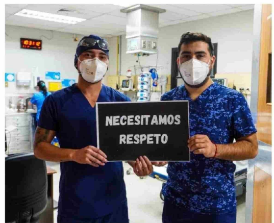
LOS PROPIOS FUNCIONARIOS de la salud han hecho campañas para concientizar por el respeto a su trabajo.

Sin embargo, la situación en la Urgencia presenta un panorama distinto. En 2021 sólo hubo un caso reportado en dicha unidad, pero la cifra ascendió a tres en 2022, 27 en 2023 y 22 en 2024. Pese a la leve merma de casos durante el año pasado, esto refleja una tendencia al alza en la violencia dentro de este servicio crítico.