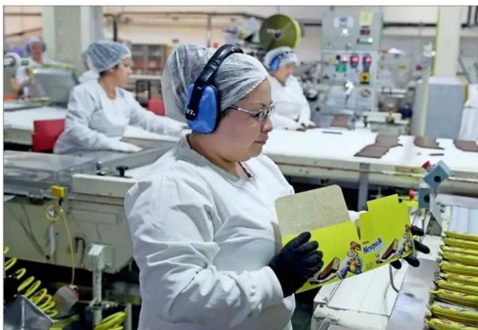
La tasa de participación de las mujeres llegó a un mínimo histórico de 41,2%, en el período mayo-julio de 2020. Mientras que la de los hombres se situó en un 62%.

Ello implicaría aumentar hasta 3,2 puntos el crecimiento del PIB, por sobre lo perdido con la crisis de la pandemia. Además, se generarían hasta 558 mil empleos adicionales de mujeres.