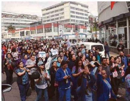
POR UNOS MINUTOS, FUNCIONARIOS SALIERON A LAS CALLES.

Con un diagnóstico claro, ofuscados en buscar res-