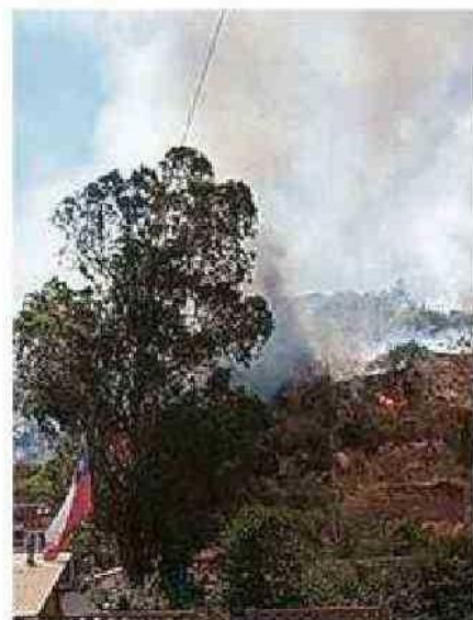
CONAF Y BOMBEROS TRABAJÓ.