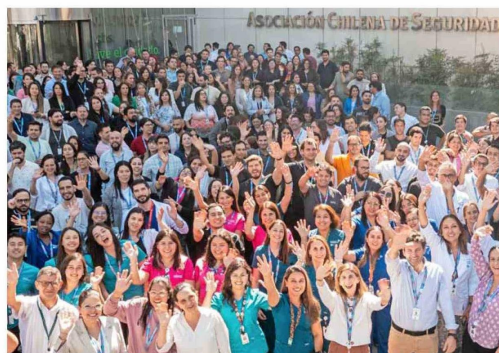
En el Día del Trabajador se inauguraron las nuevas instalaciones del Hospital del Trabajador Achs Salud.