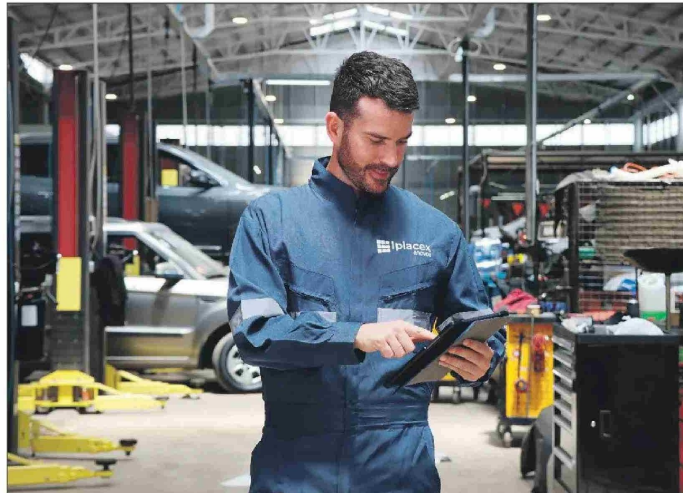
Un mecánico actualizado trabaja principalmente con sistemas electrónicos.

"Es una carrera versátil y con oportunidades en sectores tan diversos como minería, agricultura, comercio, turismo, transporte portuario y aeroportuario, almacenaje, abastecimiento y más. Los técnicos tienen una empleabilidad de 95,3% y un ingreso promedio de $863.500 al primer año. Los ingenieros tienen un sueldo de $1.238.000 al primer año de egreso".