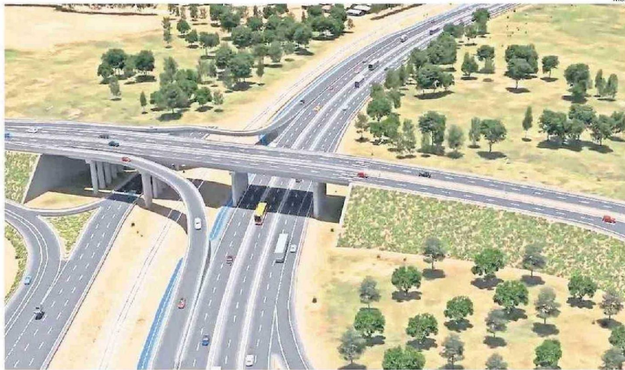
LA RUTA PIE DE MONTE ES UNO DE LOS PROYECTOS EN LA REGIÓN DEL BIOBÍO QUE NO HAN AVANZADO POR CULPA DEL CENTRALISMO.

"Este tema ha llevado no solamente a la situación del Puente Perales, si-