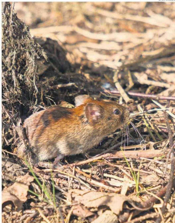
EL OLIGORYZOMYS LONGICAUDATUS ES EL ROEDOR PORTADOR DEL VIRUS ANDES.

Los nanoanticuerpos se consideran una versión simplificada de los anticuerpos convencionales y tienen la capacidad de neutralizar un