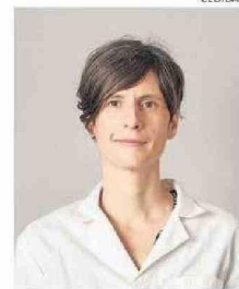
TISCHLER ES BIOTECNÓLOGA.

En esa línea, Tischler comenta que “nos enfocamos en generar un abanico de anticuerpos altamente específicos para el virus Andes, porque sabemos que