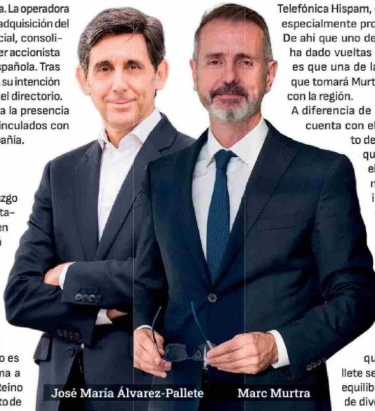
José María Álvarez-Pallete

las naciones operan bajo el alero de Telefónica Hispam, una división que a juicio de analistas españoles, contiene los activos que son candidatos a ser vendidos, cuando aparezca una buena oferta.