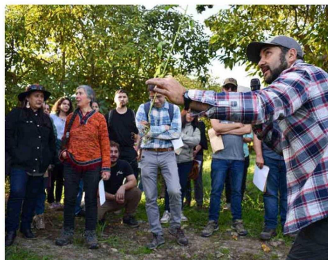
La iniciativa deviene de una propuesta para difundir experiencias exitosas e innovadoras en el manejo sostenible de los suelos.

y que está conformada por distintas entidades del agro, entre ellas, Indap, INIA, SAG, CNR, Conaf, Infor, FIA; además de estar presente el Gobierno Regional, Centro Regional Ceres, PUCV, Nodo CIV-Val y Perfruts; se propuso la promoción de actividades que tuvieran como objetivo la sostenibilidad de la agricultura. Una misión que no tardó en dar resultados y que, bajo la figura de seminario internacional, congregó a distintos expositores a conversar sobre gobernanza, innovaciones tecnológicas, y mecanismos para el intercambio de conocimiento.