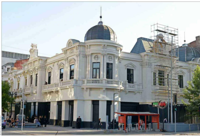
Así luce hoy el Palacio Aldunate, donde todavía se están realizando trabajos de restauración.

Después del incendio que en 2013 destruyó gran parte de su estructura, el emblemático inmueble, ubicado en pleno corazón del barrio República, resurge como un testimonio de la historia arquitectónica chilena, enfrentándose al desafío de balancear su restauración con las necesidades de este siglo.