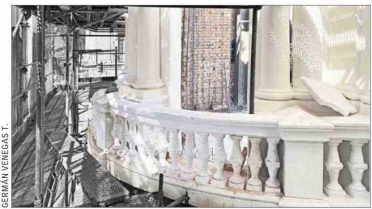
Detalle de las obras al interior del inmueble.

dad flotante y eleve su calidad de vida”, agrega.