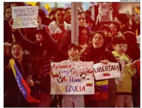
UN GRAN NÚMERO DE VENEZOLANOS PODRÁ VOTAR EN OCTUBRE.