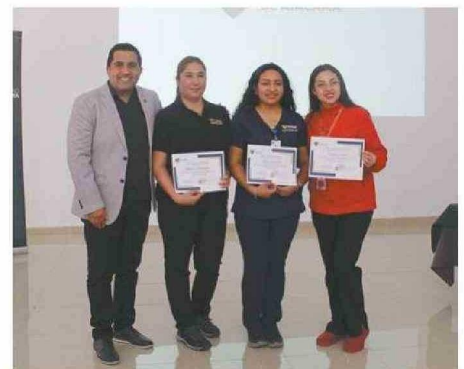
PROGRAMA SE IMPLEMENTÓ POR DOS AÑOS.