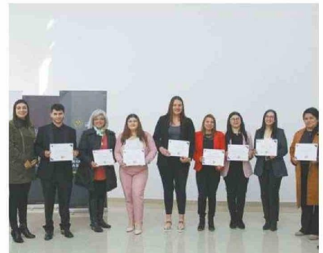
ESTUDIANTES REALIZARON LA INICIATIVA EN LA PROVINCIA DEL HUASCO.