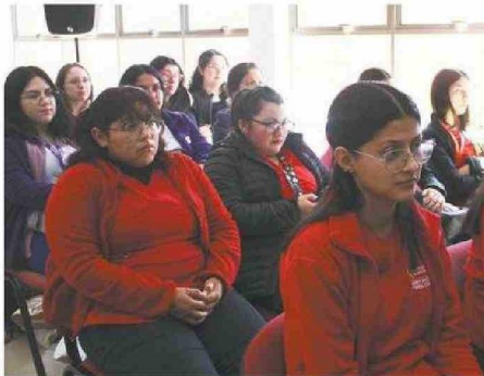
SE PRESENTARON LAS EXPERIENCIAS OBTENIDAS DEL PROYECTO.