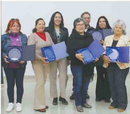
ACTIVIDAD SE REALIZÓ EN SEDE VALLENAR UNIVERSIDAD DE ATACAMA.