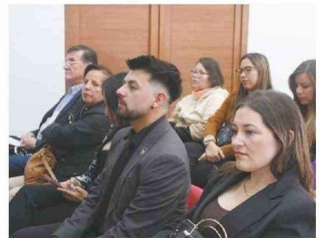
APUNTAN A UN ENFOQUE NUEVO DE SALUD.