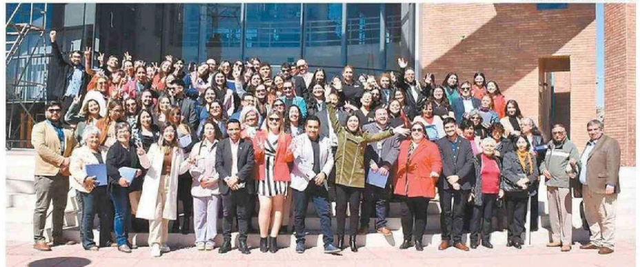
LAS ESTADÍAS DE LOS Y LAS ESTUDIANTES EN LAS LOCALIDADES Y COMUNAS DE LA PROVINCIA, ESTUVIERON FAVORECIDA POR LA RESIDENCIA SALUDUDA.