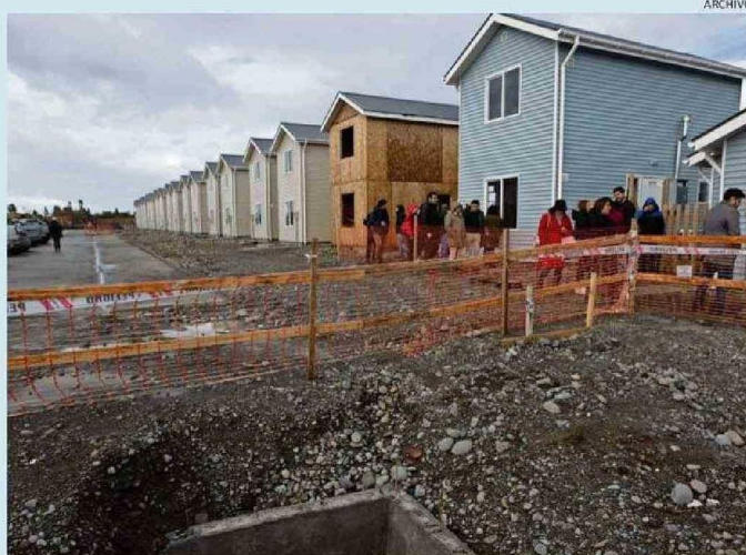
EL AVANCE DEL PLAN DE EMERGENCIA HABITACIONAL, DESTACÓ -ENTRE OTROS- EL SEREMI DE ECONOMÍA.

programa Desarrollo Productivo Sostenible (DPS), "que busca impulsar una matriz productiva más sostenible y sofisticada, mediante la incorporación de mayor conocimiento, innovación y tecnología, hemos financiado diversas iniciativas regionales por más de $4.825 millones".