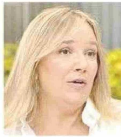
María José Hoffmann.