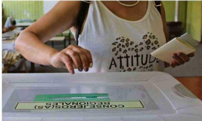
LAS ELECCIONES EN TODO EL PAÍS SE REALIZARÁN EL DOMINGO 24 DE OCTUBRE, CON VOTO OBLIGATORIO.