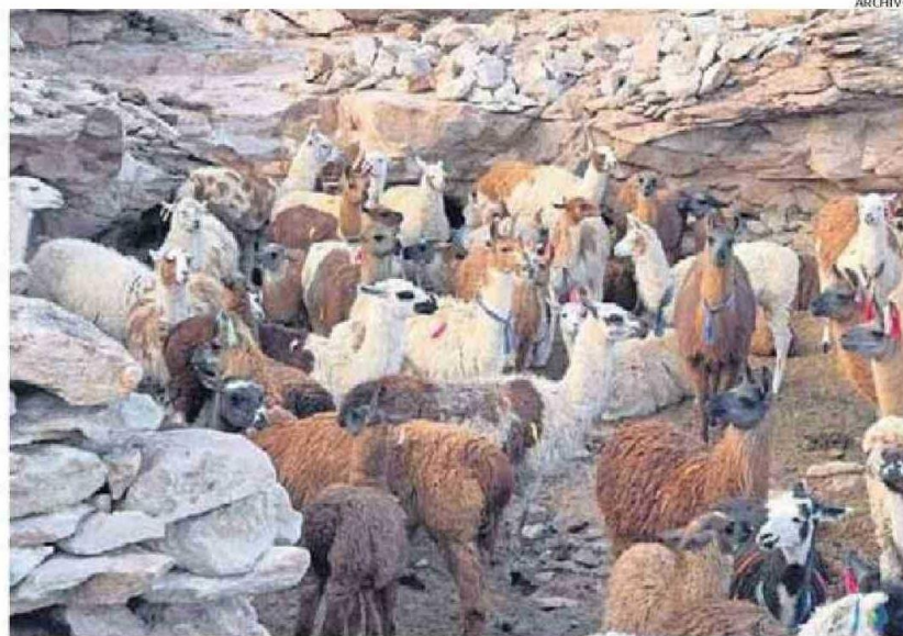
PREOCUPACIÓN POR FAENAMIENTO IRREGULAR ABRE OPCIÓN DE INSTALAR PLANTA DE FAENA DE BAJA ESCALA

Asimismo, la personera regional, planteó que “son pro-