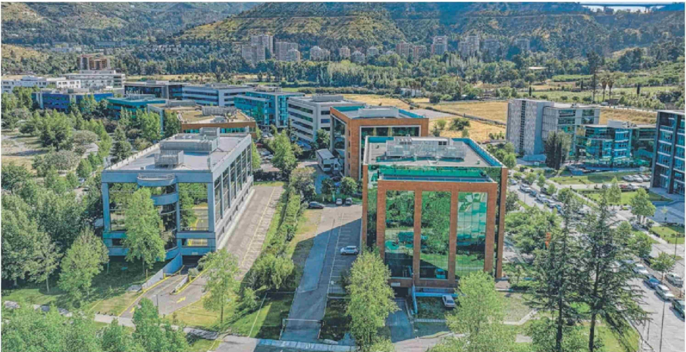
El nuevo campus Ciudad Universitaria, en Huechuraba, de la Universidad San Sebastián, consta de cinco modernos edificios para gestión, docencia e investigación.

L a Universidad San Sebastián (USS) ha seguido su plan de inversiones en infraestructura para el mejor desarrollo de sus actividades. En ese marco, anunció la inversión de US$ 65 millones que incluyen la apertura del campus Ciudad Universitaria, en Huechuraba; la construcción de un nuevo edificio en el campus Paicaví en Concepción; y la habilitación de un segundo Centro de Salud docente-asistencial en Valdivia.