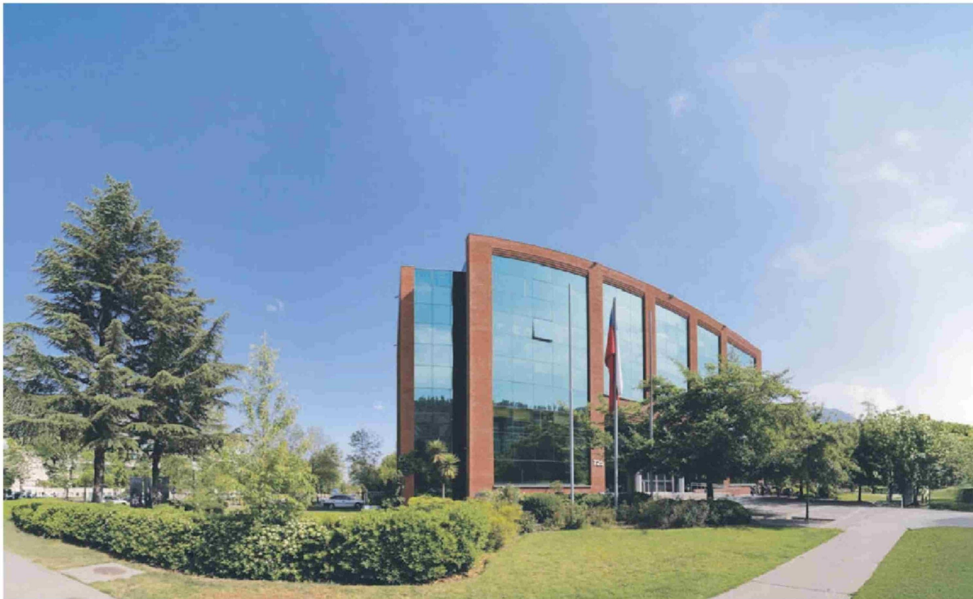
El nuevo Parque de Ciencia, Innovación y Emprendimiento de la Universidad San Sebastián en Huechuraba.