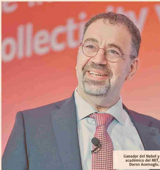
Ganador del Nobel y académico del MIT, Daron Acemoglu.